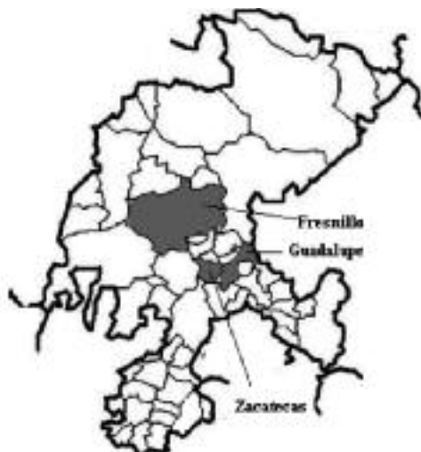
Figura 4. Principais municipios de Zacatecas

A zona metropolitana Zacatecas-Guadalupe é a máis poboada do Estado, con 298.167 habitantes. Séguenlle Fresnillo, con 213.139 habitantes; Río Grande, con 62.693 habitantes; Sombrerete, con 61.188 habitantes, e Jerez, con 57.610 habitantes (2010). Por este motivo, nesta investigación tómanse as tres zonas máis poboadas: Zacatecas, Guadalupe e Fresnillo: