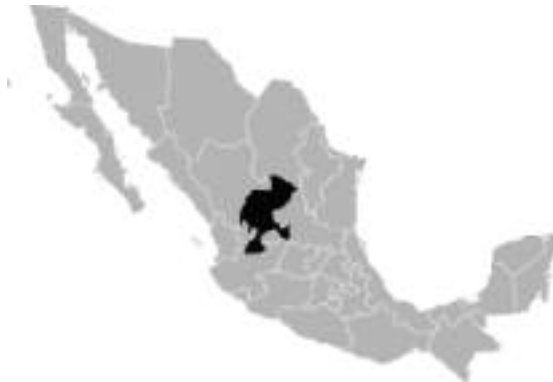
Figura 3. Localización do estado de Zacatecas

Zacatecas é un dos 31 estados que, xunto co Distrito Federal, conforman as 32 entidades federativas de México.