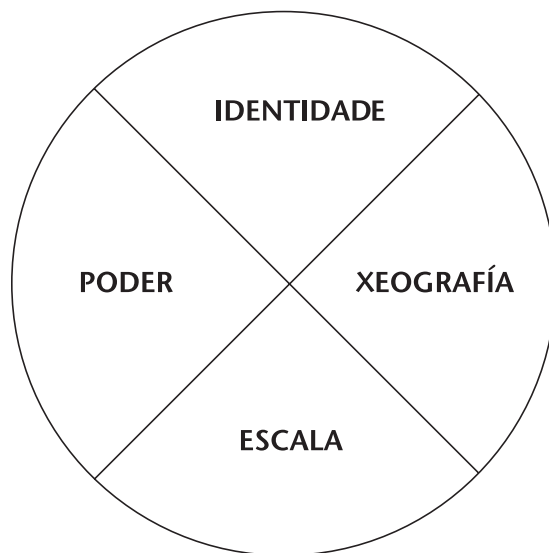
FIGURA 1. Elementos de “local”